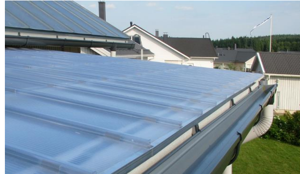
Takuu rajoitettu 5 v.