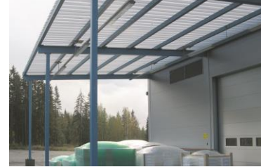
Takuu raj. 10 v.